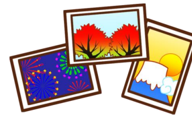
画像の加工・生成